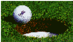
Responsable : André Gendre